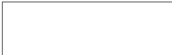
Tabuľka Kontrolný zoznam pre hodnotenie možných rizík